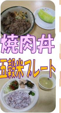
焼肉丼 五穀米プレート

8月1日(土)は、夏のスタミナ増加へ！みなさん大好きな「お肉」をたっぷりのせた「焼肉丼」が昼食でふるまわれました。やわらかいお肉が2種類！！カルビとサーロインがたくさん載っていて、見た目も豪華！さらに、付け合せのキムチを上に乗せて「キムチ焼肉丼」へとアレンジする方もいらっしゃいました。デザートには、なんと！！「メロン」最高です！！濃厚な焼肉丼からのさっぱりメロンの組み合わせは「幸」の一言！心もお腹も満腹ですね♪